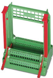
Halter für MOCAN